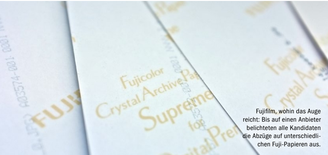
Fujifilm, wohin das Auge reicht: Bis auf einen Anbieter belichteten alle Kandidaten die Abzüge auf unterschiedlichen Fuji-Papieren aus.

wirklich überzeugen. Doppelt gesicherte Verpackung, Seidenpapiertrenner zur Schonung der Oberflächen sowie umfangreiche Einstellmöglichkeiten inklusive zahlloser, auch individueller Formate im Bestelltool machen deutlich, warum ein einzelner Abzug hier deutlich teurer ist als bei unseren fünf Testkandidaten. Ob es Ihnen den Aufpreis wert ist, können Sie nur selbst entscheiden. Wer Wert auf höchste Farbtreue oder spezielle Formate in ultimativer Papierqualität